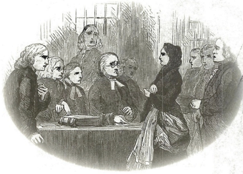
Anne Hutchinson stood up for her beliefs about religion.

後來，她的想法改變了，她認為信念(faith)比遵守教會的一些規定還重要。她冒險告訴別人她對宗教信仰的想法。冒險(risk)就是雖然知道可能會有不好的事情發生，但是仍然勇敢地去做。跟她在在一起的人不喜歡她的新想法，而且不要她說出來。所以他們終於在1637年把她趕走。今天有一些人覺得Hutchinson是一位很勇敢的英雄(hero)。